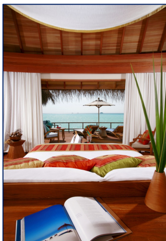
Anantara Dhigu 5+*