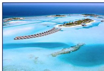
Anantara Dhigu 5+*