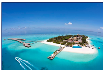
Velassaru resort 5*