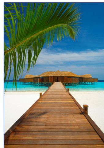
Lily beach resort 5*

Cena zahŕňa: leteckú prepravu Viedeň – Male – Viedeň so spoločnosťou Qatar Air • 7 x ubytovanie raňajkami ( vo rezorte Lily All Inclusive ) • privátna preprava z letiska do rezortu a späť ( motorový čln alebo seaplane ) • povinné poistenie voči insolventnosti CK