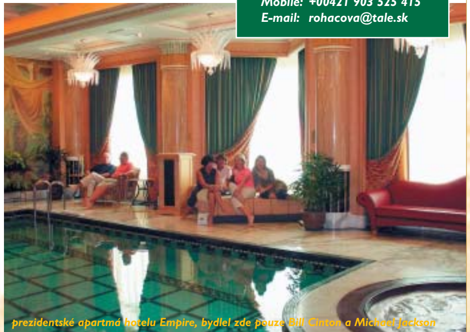
prezidentské apartmá hotelu Empire, bydlel zde pouze Bill Clinton a Michael Jackson

řích restauracích vám ho i dovolí nalít. Chcete-li zažít očišťovací kúru, pak dovolená v Brunei je nejlepší typ. Velkorysost na nás dýchla i v hotelu Empire, ve kterém jsme bydleli a který v průběhu stavby měl neomezený rozpočet. Zlaté sloupy v lobby baru, zlaté kliky u dveří vás přivedou v úžas. Golfový klub, který sousedí s hotelem poskytuje neuvěřitelné pohodlí. Whirpool, sauna, bazén, tři tenisové kurty, squashové kurty, volejbal, bowling, kino a divadlo. Hřiště, které projektoval Jack Nicklaus má mimořádnou úroveň.